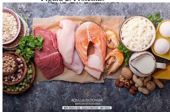
Figura 2: Proteínas