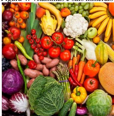
Figura 4: Vitaminas e sais minerais