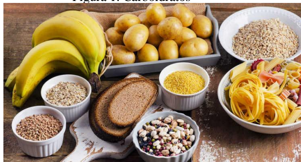
Figura 1: Carboidratos