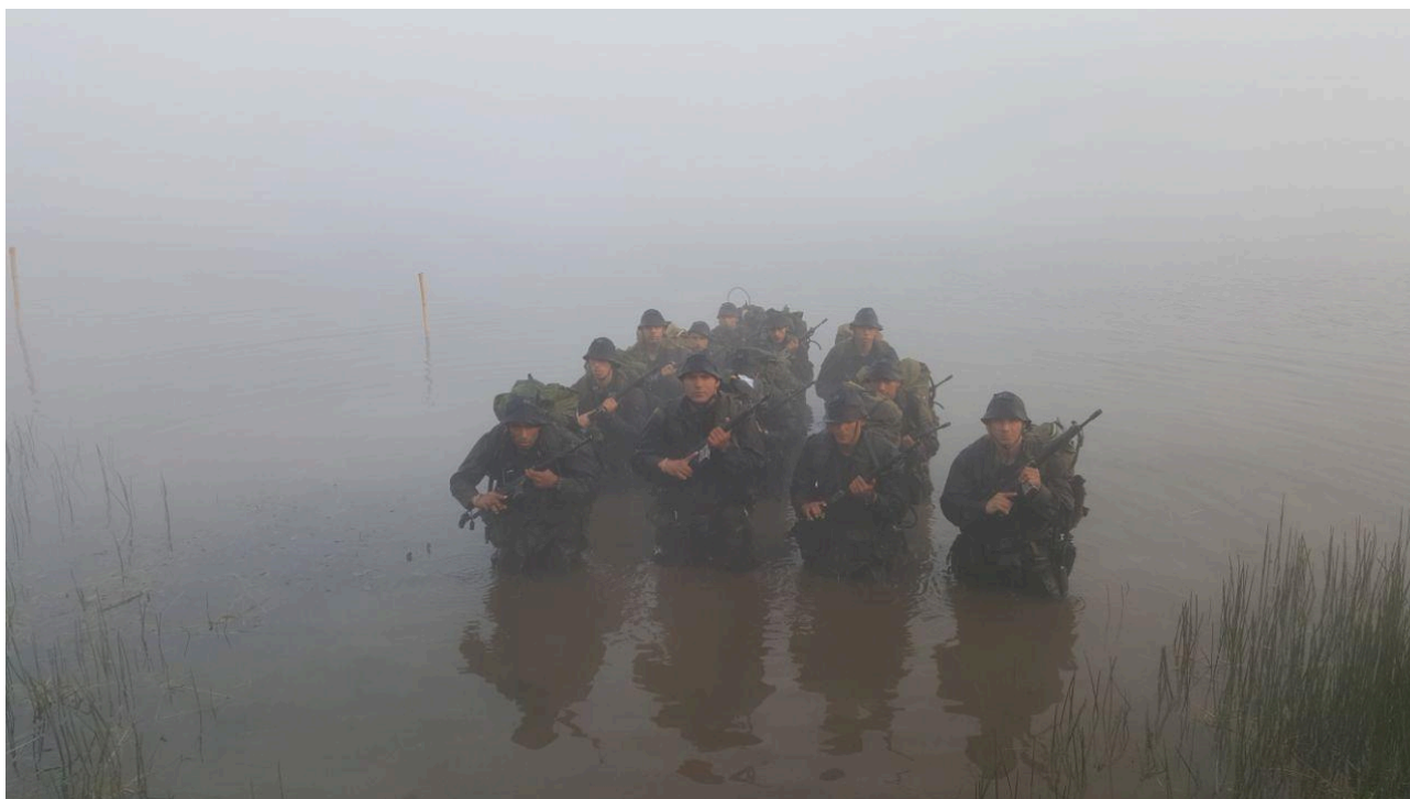
Figura 2 Utilização de estímulos estressores na fase de seleção do CCFA