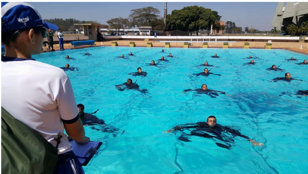
Figura 1 Teste de Avaliação do Condicionamento Físico Específico (TACFE) aplicado aos Candidatos na fase administrativa do CCFA