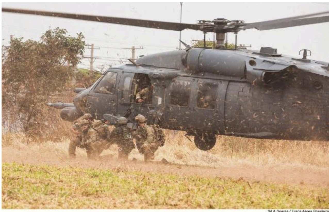
Figura 4 Ação Direta precedida de Infiltração Aeromóvel na Tápio 2021

demonstraram elevado nível de adestramento, coordenação e capacidade de atuação em cenários operacionais complexos (CECOMSAER, 2021).