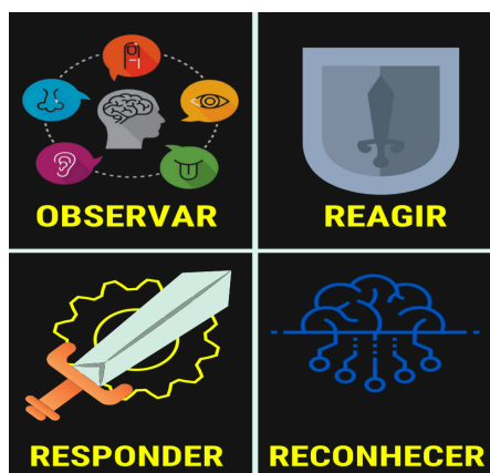
Figura 3 Ciclo O3R

confrontos armados, nos quais o tempo de reação é limitado, enquanto que o processo O3R engloba as seguintes questões: “Observe, Reaja, Reconheça, Responda” (Pincus 2014 apud Pereira 2021). Este se mostra mais adequado para situações que necessitam reações imediatas e intuitivas baseadas em treinamento prévio.