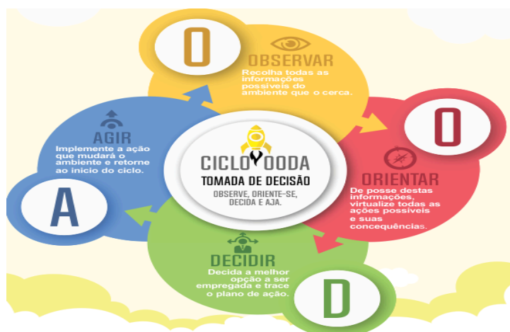
Figura 1 Ciclo OODA