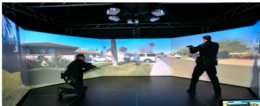
Figura 5 Uso de Virtra 300 LE