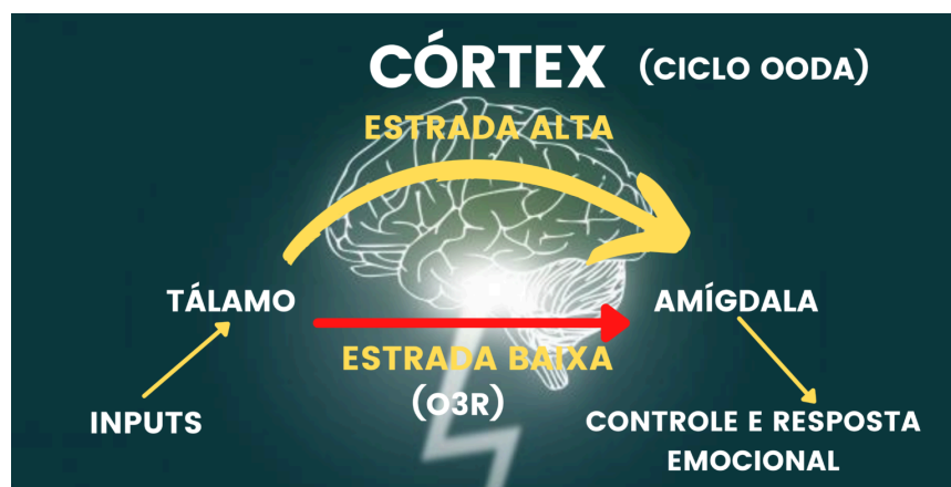
Figura 4 O caminho da tomada de decisão na “estrada alta” e na “estrada baixa”

reações reflexas ou instintivas, que dispensam análise consciente. Em contraposição, Esperandio (2021) propõe uma segunda situação: você observa o chute sendo realizado por um jogador a cerca de 20 metros de distância. Com tempo para perceber a trajetória da bola, você pode deliberar entre desviar-se ou tentar agarrá-la. Nesse segundo cenário, o autor explica que há espaço para a ativação do ciclo OODA, pois a decisão é tomada com base na observação, análise e escolha consciente de elementos que exigem envolvimento cognitivo e tempo de processamento racional.