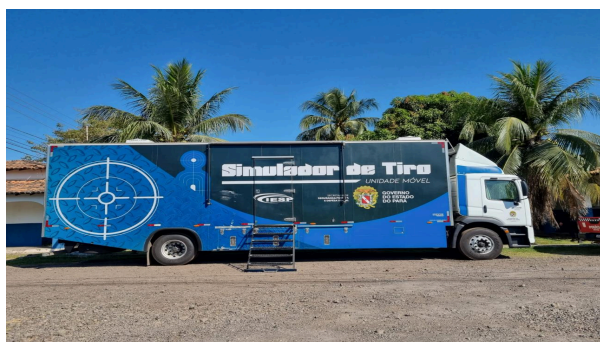
Figura 7 (STAP Modelo Móvel)