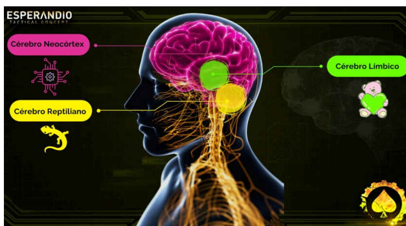
Figura 2 Sistema cognitivo