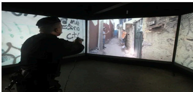
Figura 8 (Modelo STAP 180)