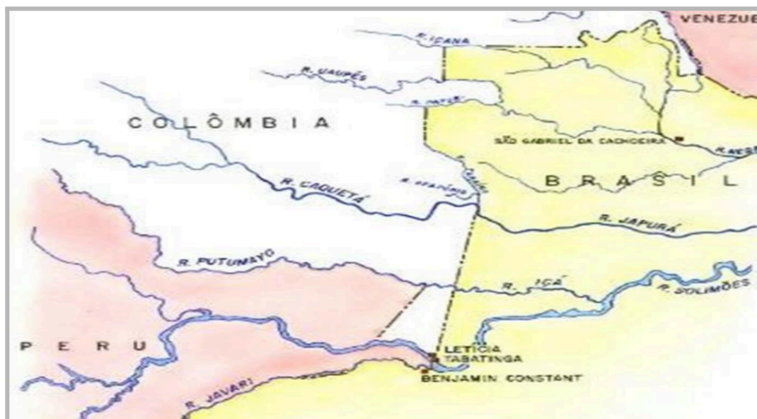
Figura 2 Fluxo fluviais no Trapézio Amazônico

especial, a atuação da FDN ao longo do trecho entre Tabatinga e Manaus demonstra que existe uma rota consolidada de escoamento da cocaína até os grandes centros urbanos e, posteriormente, para o exterior (MOURA, 2020).