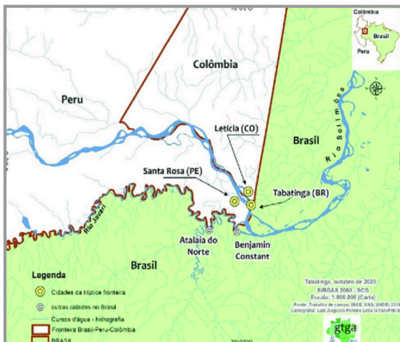
Figura 1 Espaço da Tríplice Fronteira entre Brasil, Colômbia e Peru

a área se transformou em uma das principais portas de entrada de drogas no Brasil e em um corredor para o tráfico internacional (Moura, 2020, p. 14). A situação se torna ainda mais delicada com a presença de comunidades indígenas, muitas vezes isoladas, que acabam sendo alvo fácil para facções criminosas (Araújo, 2018).