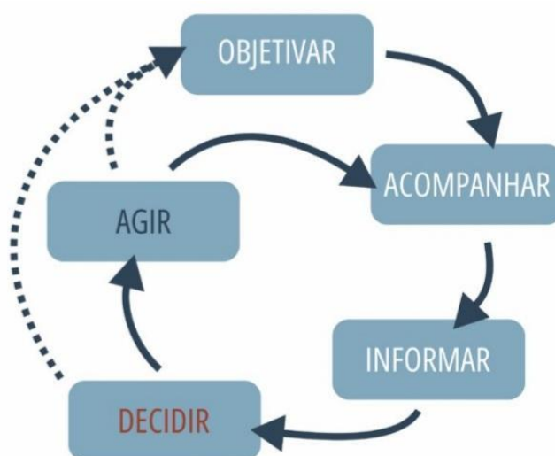
Figura 1 Ciclo da Inteligência