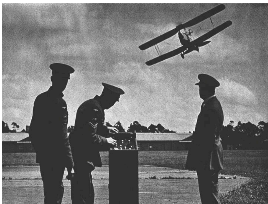
Figura 1 Alvo Aéreo Ruston Proctor

Plataformas não tripuladas são tecnologias que, por mais que pareçam conceitos novos, já foram abordados e utilizados em conflitos do passado. Esse tipo de artifício era estudado visando levar artefatos explosivos pelo ar até um alvo distante. Em 1916 houve a aparição de uma das primeiras ARPS, o RPAT ( Ruston Proctor Aerial Target ), que podia ser controlado por meio de rádio rudimentar, foi criado para desempenhar função de alvo aéreo e, posteriormente, serviu de base para a evolução de sua categoria de aeronaves (Andreatta, 2022).