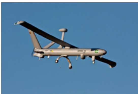
Figura 2 Hermes RQ-450