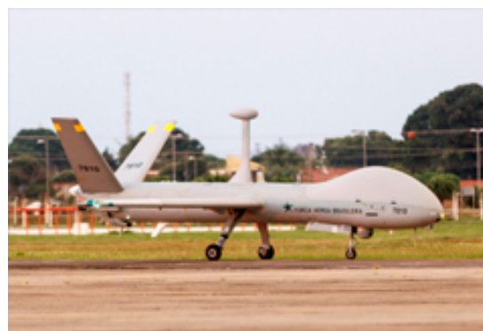
Figura 3 Hermes RQ-900