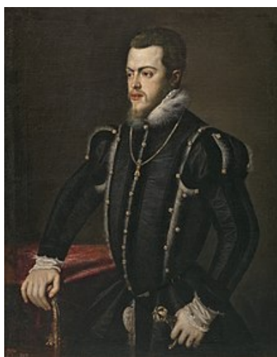
Figura 1 - Filipe II retratado por Ticiano, 1550