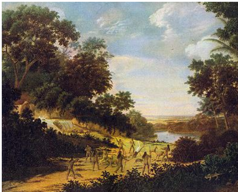
Figura 5 - Índios Caçando e Lutando, 1667. Óleo sobre madeira confeccionada pelo paisagista Frans Post, um dos artistas que embarcaram com Maurício Nassau em sua vinda para o Brasil Disponível em: https://enciclopedia.itaucultural.org.br/obra24412/indios-cacando-e-lutando . Acesso em: 09 abr. 2024.

Logo na sua chegada, Nassau iniciou uma campanha para reconquistar Porto Calvo, na qual foi vitorioso, forçando o exército de resistência para o sul do rio São Francisco. Nassau, então, edificou um forte no vilarejo de Penedo, o qual foi batizado com seu nome (Mello, 2009). Segundo Boxer (1961, p. 100), “toda a capitania de Pernambuco estava agora livre do inimigo, que se retirara para Sergipe, onde João Maurício não fez nenhuma tentativa para persegui-lo”.