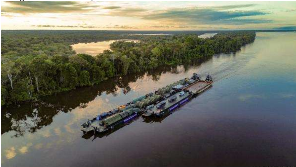
Fotografia 1 – Balsas e empurradores da COMARA.

Conforme é possível se depreender das informações acima, as balsas e os empurradores da COMARA detêm elevada aptidão para o exercício de atividades de transporte logístico. Considerando uma eventual disponibilidade integral dos equipamentos, as balsas suportam transportar o montante de 10.160 toneladas, ao passo que os empurradores conseguem fornecer propulsão a 12.000 toneladas de carga embarcada. A fotografia abaixo exemplifica a utilização de um desses ativos.