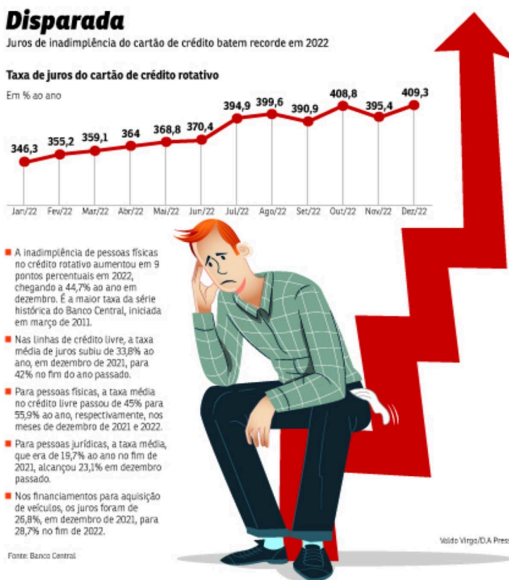
Figura 3 Aumento da taxa de juros do cartão de crédito rotativo

maior que 10% ao mês e o pagamento do Imposto sobre Operações Financeiras, o qual se deve arcar com uma taxa de 0,38% do valor devido, além de uma taxa diária de 0,0082%, até que tudo seja quitado. A situação torna-se preocupante quando opta-se por pagar somente a fatura mínima, correspondente a 15% da fatura, uma vez que a taxa de juros do crédito rotativo chegou a 409,3% ao ano no fim de 2022, segundo dados da série estatística do Banco Central (BC) presentes na figura abaixo: