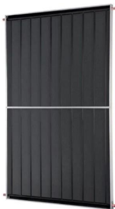
Figura 3 Coletor Komeco - Princess