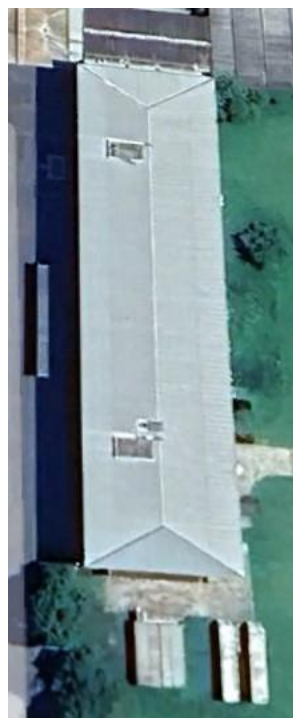
Figura 5 Alojamento 4º ano