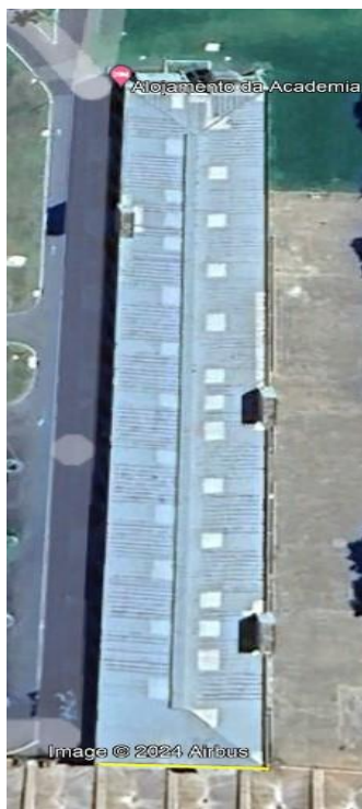
Figura 4 Alojamento 2º/3º ano