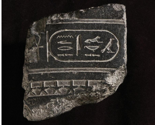
Figura 3 - Nome do faraó Alexandre em escrita hieroglífica.