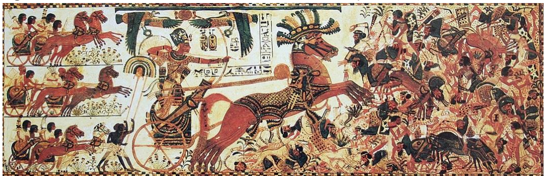
Figura 2 - O faraó, como defensor da Maat, lutando contra as forças do caos.

A relação entre o faraó e Maat era simbolizada na arte, principalmente nas cenas de guerra onde o seu poder era investido para preservar Maat (MOLINERO; SOLA, 2000). Na Figura 2, é possível ver essa simbologia através da arte do rei Tutankamon com sua tropa, representados de forma simétrica e com os pés plantados no chão, alinhados e ordenados, significando o equilíbrio e a harmonia. Por outro lado, os inimigos são representados flutuando na imagem, simbolizando o caos e a desordem.