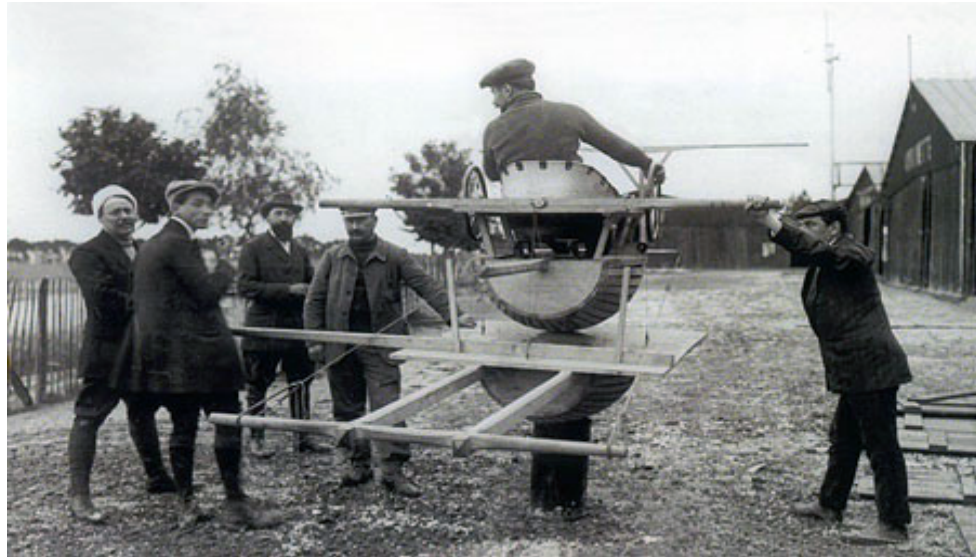
Figura 2 Simulador de voo Antoinette

Após a criação do aparelho de simulação “ Sanders Teacher ”, os inventores que o sucederam tinham como objetivo montar uma máquina que simulasse uma aeronave. Surgiu-se então o primeiro conceito de simulação de voo (GOMES, 2019). Um simulador da época que teve grande destaque foi o “Barril de Aprendizado de Antoinette”, que era dotado de articulações (BRASIL, 2016).