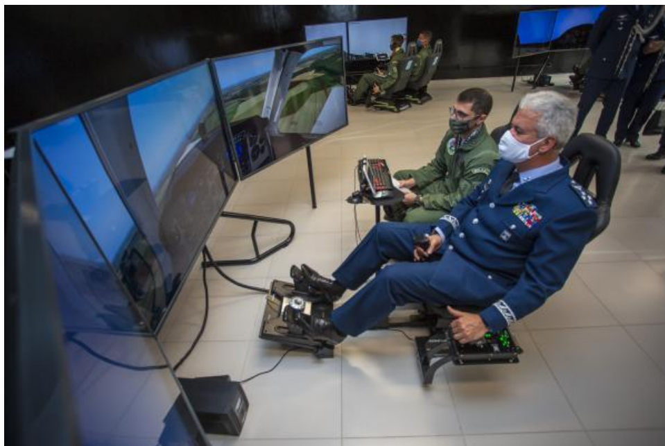
Figura 3 Simulador T-2000

de voo, regras de tráfego aéreo, até os conceitos mais avançados de pilotagem, a exemplo de manobras e acrobacias, voo de formatura, voo noturno e voos de navegação visual e por instrumento” (BRASIL, 2020, p.1).