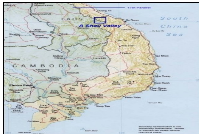
Figura 1 Mapa da localização do Vale A Shau no Vietnã

Em 1965 ocorreu um ataque a Pleiku, no planalto central da província de Thua Thien, o qual levou à morte de 8 conselheiros americanos e incentivou um ataque de bombardeio ao Vietnã do norte. Após esse ataque, o Presidente Lyndon B. Johnson aprovou que soldados americanos fossem enviados ao Vietnã. O General William C. Westmoreland recebeu determinações de negar aos norte-vietnamitas a capacidade de suprimento logístico, com esse objetivo em mente o ponto crucial era o controle do Vale A Shau, no qual os vietnamitas do norte desenvolveram bases logísticas (BOIAN, 2012).