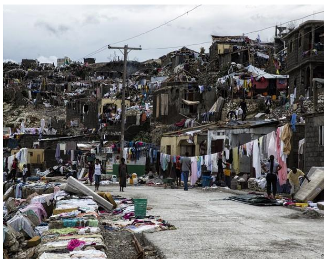
Figura 4 Passagem Furacão Matthew, Haiti

A figura a seguir mostra o Haiti após a passagem do furacão Matthew.