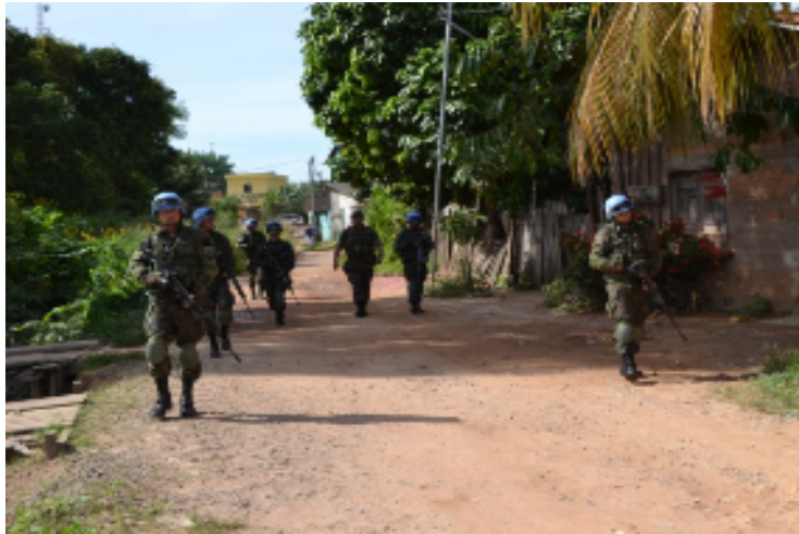
Figura 6 Treinamento 20º Contingente

observa-se o emprego desses conhecimentos na MINUSTAH.