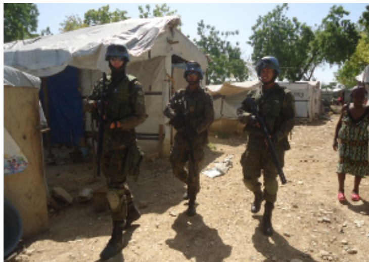
Figura 7 Patrulha a pé em IDP, Haiti