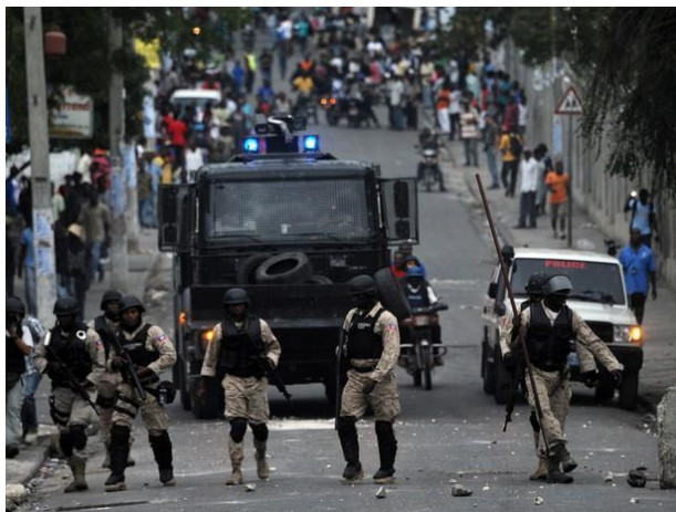
Figura 5 Manifestações políticas em Porto Príncipe, Haiti