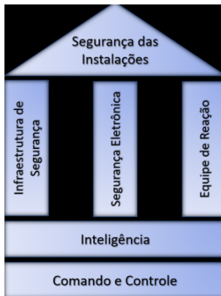
Figura 1 Representação do conceito de Segurança das Instalações