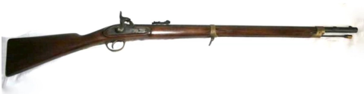
Figura 1 Carabina Minié

Ao início da Guerra do Paraguai, o exército brasileiro já estava equipado com armamentos modernos. Foram adquiridos 27.000 fuzis e carabinas raiados, 85 canhões igualmente raiados e 17.000 projéteis cilíndricos de artilharia (GONÇALVES, 2012). A infantaria utilizava espingardas longas, modelo Minié ou Enfield, e a infantaria leve utilizava carabinas mais curtas que as espingardas utilizadas pela infantaria pesada. A cavalaria estava equipada com carabinas e lanças, e, por sua vez, a artilharia possuía canhões La Hitte (CASTRO, 2008). Vale ressaltar que, diferentemente dos dias atuais, os armamentos não eram padronizados, o que gerava grande dificuldade logística e operacional. Por isso, foram utilizados diferentes tipos de armamento no conflito, em maior ou menor quantidade.