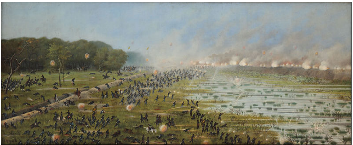
Figura 3 Assalto da Primeira coluna brasileira à Curupaiti

naquele rio, contra a aproximação da esquadra imperial (GONÇALVES, 2009). Estava assentado em um terreno muito elevado, o que garantia enorme vantagem militar para seus defensores. Possuía 13 canhões dispostos paralelamente ao rio, além de uma trincheira de 900 metros que se estendia a leste, até a lagoa Mendez. A imagem abaixo, ilustrada por Cândido Lopez, que combateu em Curupaiti, é capaz de elucidar a disposição do campo de batalha: