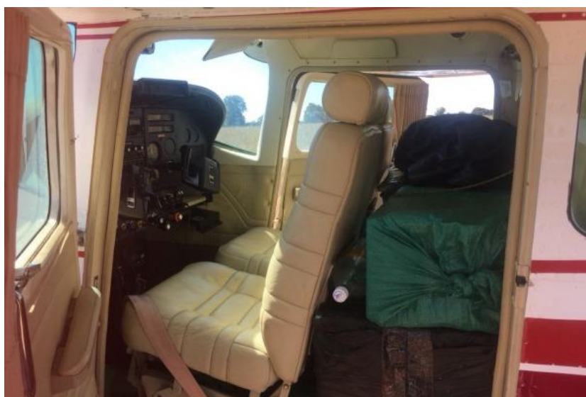
Figura 2 Aeronave carregada com Cocaína interceptada por aeronave de Caça da FAB

Ainda no prisma de atuação do SISDABRA, o sistema também engloba ações contra crimes ambientais. Ainda segundo a FAB (BRASIL, 2022b) a operação ‘Ágata’, ocorrida no ano de 2022, contou com o auxílio de plataformas satelitais para a localização de focos de exploração mineral ilegal (garimpo).