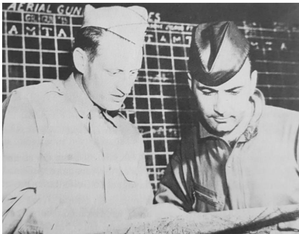
Figura 1 Coronel Gabriel Disosway e Tenente-Coronel Nero Moura

Diante dessa exigência e cobrança por parte deste comandante, o Grupo de Caça começou a operar como uma unidade tática completa, participando efetivamente da defesa aérea do Canal do Panamá, inclusive com missões de interceptação. Dessa forma, realizaram cerca de 100 saídas operacionais, que corroboraram para a formação da pronta resposta e trabalho articulado entre aviadores e pessoal de terra (LANZA, 2020; VAZQUEZ, 2023).