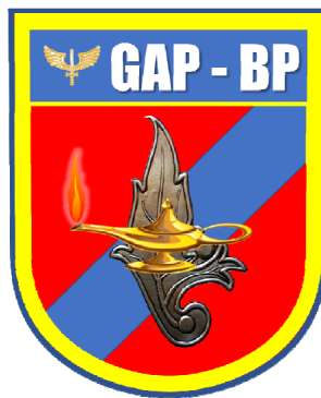
Figura 2 Distintivo de Organização Militar – Grupamento de Apoio Brig Int PONTES

Em 2022, a ICA 37-758 (BRASIL, 2021) expõe que o CPAINT teve carga horária de 960 horas-aula, distribuídas em 138 (cento e trinta e oito) dias letivos, com dedicação exclusiva. Sua aplicação foi realizada na Diretoria de Administração da Aeronáutica (DIRAD), por meio do Grupamento de Apoio Brigadeiro Pontes (GAP-BP). O GAP-BP é uma Unidade Gestora Executora fictícia, que apresenta estrutura similar a de um Grupamento de Apoio, criada com a finalidade didática de aproximar, simuladamente, o futuro Oficial Intendente, das atividades reais e rotineiras, com as quais lidará na fase operacional de sua carreira, pertinentes a um GAP. Nessa Unidade, cada grupo de Oficiais Alunos exerce um cargo administrativo, por um tempo certo e determinado, devendo, ao longo do CPAINT, promover-se um rodízio de funções (rotação de trabalho), de modo que todos tenham a oportunidade de passar por todos os cargos previstos.