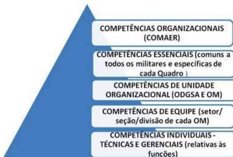
Figura 1 Denominações de competências, de acordo com o nível organizacional da FAB

No âmbito do COMAER, as competências são classificadas em diferentes tipos e denominações conforme demonstrado na figura a seguir.