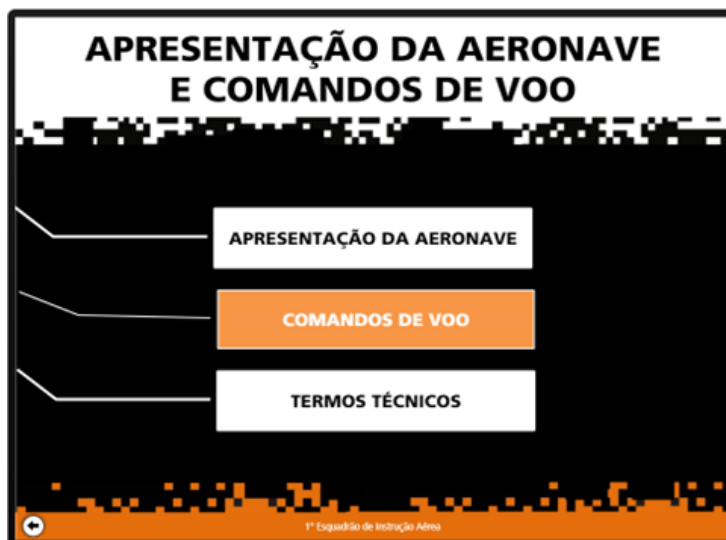
FIGURA 2 – ESCOLHA DO SUBTÓPICO