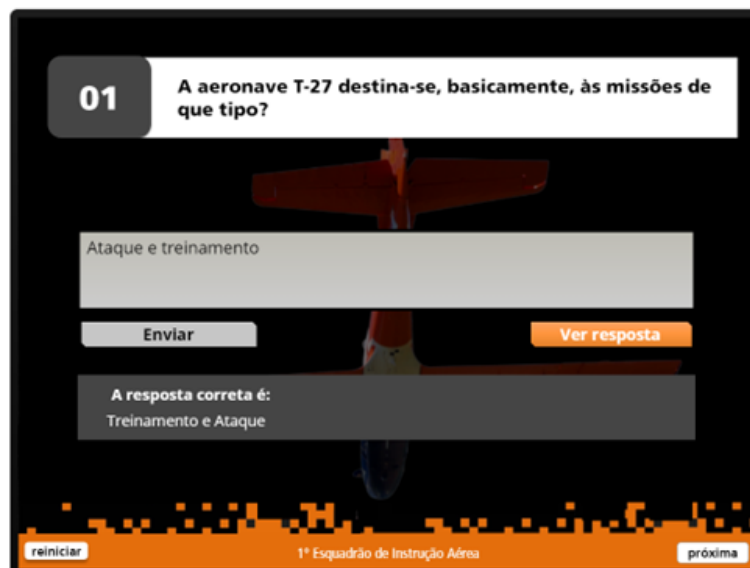
FIGURA 7 – RESPOSTA APÓS SELECIONAR “ENVIAR” E “VER RESPOSTA”