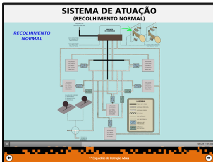
FIGURA 4 – ANIMAÇÃO DO FUNCIONAMENTO DO SISTEMA DO TREM DE POUSO