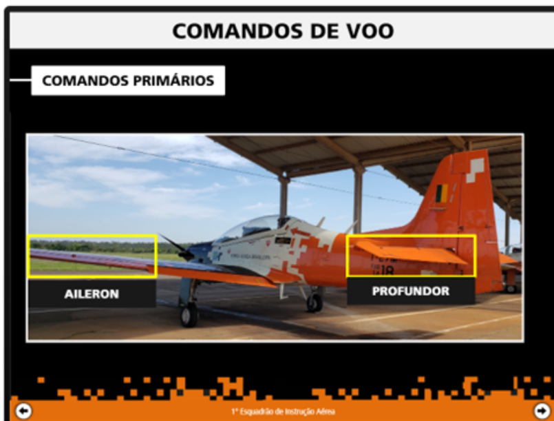
FIGURA 3 – FOTO DAS SUPERFÍCIES DE COMANDO

Um importante recurso do CBT T-27M disponível no Moodle são as fotos e vídeos feitos na própria aeronave, facilitando o aprendizado quando o instruído inicia sua preparação no avião.