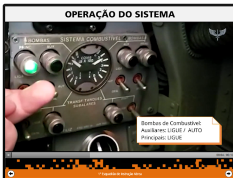
FIGURA 5 – VÍDEO DEMONSTRANDO PARTIDA COM FONTE EXTERNA