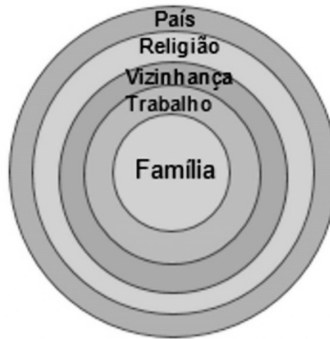
Figura 3 – Segundo Alvo das Revoluções Coloridas- O Indivíduo