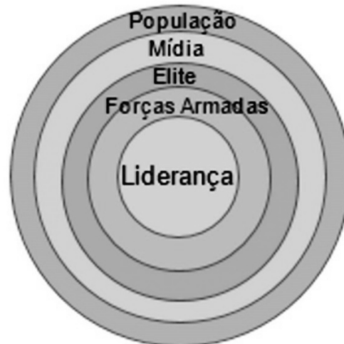
Figura 2 – Primeiro Alvo das Revoluções Coloridas- A Sociedade

Explicando a abordagem indireta das guerras híbridas, Korybko (2015) utiliza a teoria dos Cinco Anéis do Coronel John Warden e traz a mídia para a configuração, enfatizando os elementos sociedade e indivíduo e os associando aos anéis: país, religião, vizinhança, trabalho e família. Para ele, o grau de influência das mídias nacional e internacional nos Estados é variável, mas ambas agem sobre a população. Assim, as campanhas de informação das operações psicológicas devem atuar nesses anéis, representando indivíduo e sociedade, os quais sendo persuadidos e convencidos podem promover a derrubada da liderança do Estado e a tomada de poder, como no caso das Revoluções Coloridas.