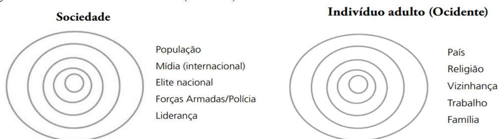
Figura 1: Sociedade e Indivíduo adulto (Ocidente) como Centros de Gravidade Sociais

Ao considerar a sociedade e o indivíduo como centros de gravidade, Korybko (2018) esclarece a quem são direcionadas as operações ideológicas, psicológicas e de informação: