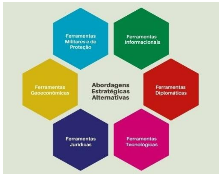
Esquema 2 – Abordagens Estratégicas Alternativas