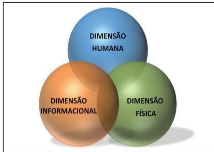
Esquema 1 – O Campo de Batalha da Guerra na Era da Informação

Ao contrário dos conflitos armados durante a ‘Idade do Aço’, cujos resultados finais foram obtidos, em geral, por meio do embate das forças armadas no campo de batalha; nas guerras pós-industriais, a vitória tem sido alcançada basicamente no ambiente informacional , de acordo com a percepção da opinião pública acerca dos fatos e dos pormenores que os cercam. (VISACRO, 2018, p. 133, grifo nosso).