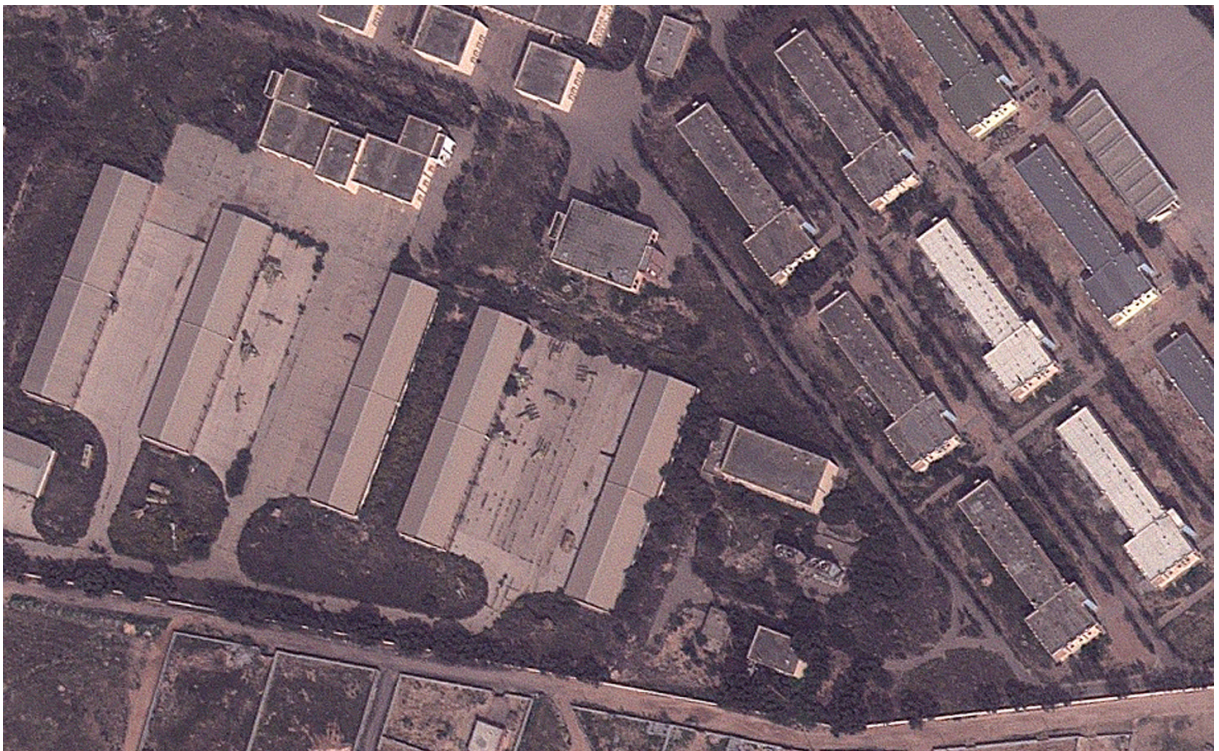
Figura 3 - Pré-ataque em depósito militar