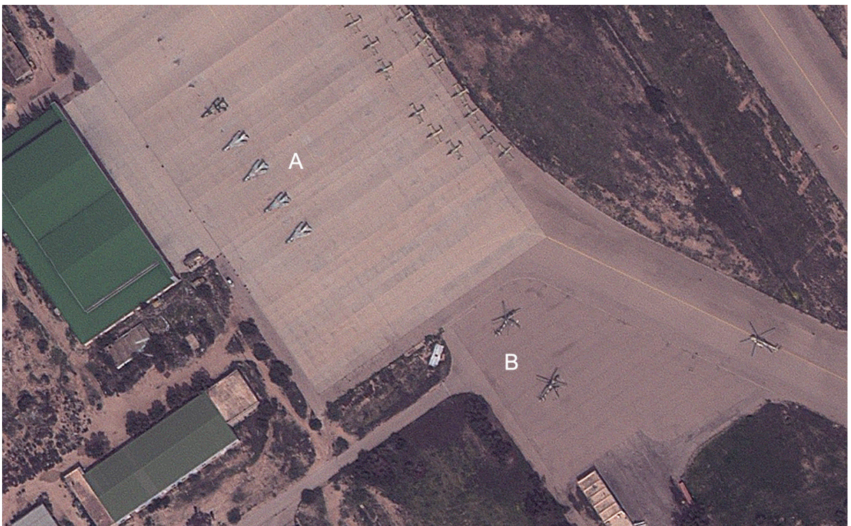
Figura 1 - Pré-ataque em aeródromo

Exemplos de precisão alcançada pelas PGM durante os ataques aéreos na Líbia podem ser observadas nas fotos pré e pós-ataque, conforme Figuras 1, 2, 3 e 4.