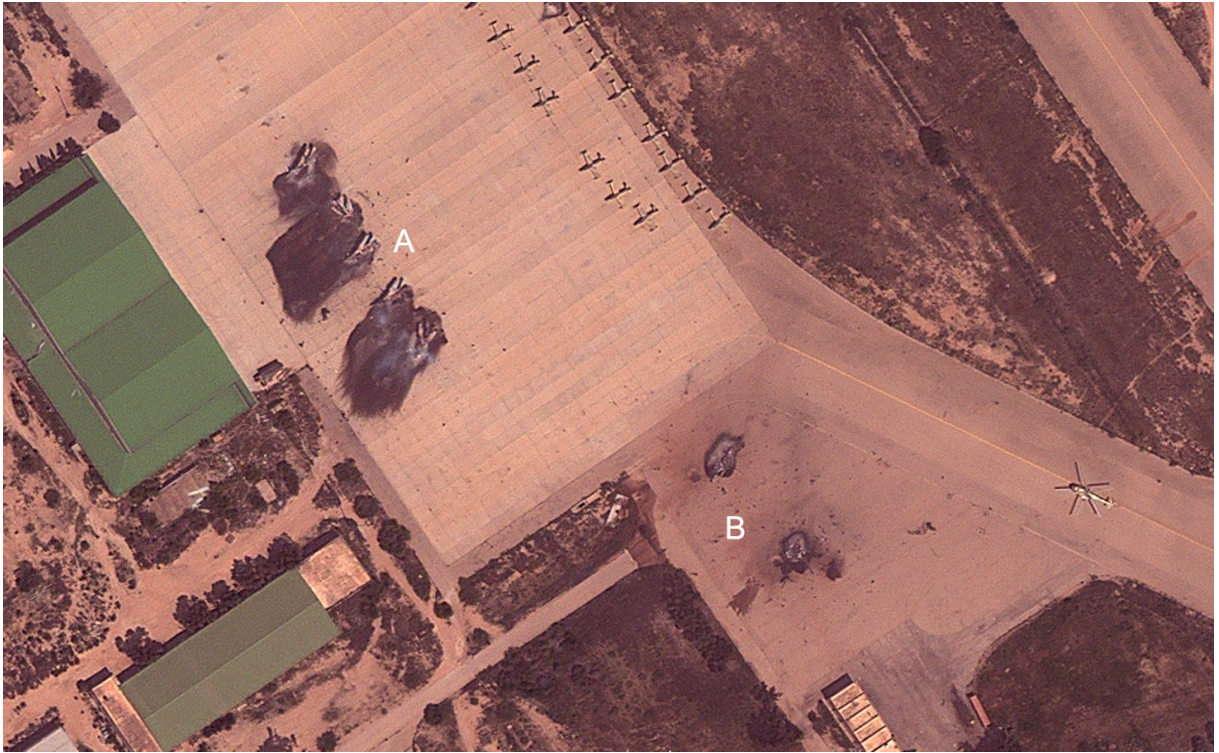
Figura 2 - Pós-ataque em aeródromo