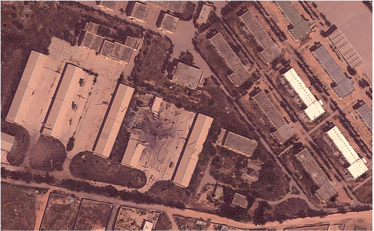
Figura 4 - Pós-ataque em depósito militar

Uma das imagens disponíveis mais esclarecedoras sobre a relevância do uso de armamentos inteligentes para a proteção da população civil é a foto pós-ataque em uma instalação de comando e controle e um prédio de comunicações na cidade de Sorman, em junho de 2011, apresentada na Figura 5. Ao mesmo tempo que as instalações foram completamente destruídas, uma mesquita e uma escola, a menos de 100 metros de um dos alvos, não sofreram qualquer dano.