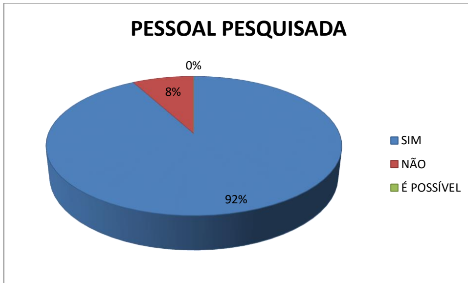
Gráfico – 3 Controle e centralização.