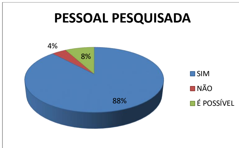
Gráfico 5 - Pontos fracos diante da ESP devido à falta de estrutura e doutrina.